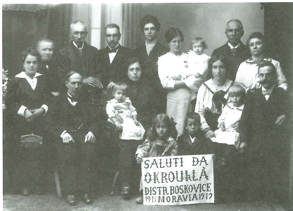
Okrouhlá 1917 - Profughi di Valle S. Felice (LAB - GB)

Začátkem června 2016 přijel celý autobus zástupců italského spolku historie na Moravu, kde mimo jiné navštívili i některá místa pobytu jejich předků a zúčastnili se odhalování pamětních míst k těmto událostem. Byl jsem také pozván na setkání s Italy ve Křtinách, kam 4. června letošního roku daný spolek dorazil, aby se seznámil s místem, kde pobýval v době 1. světové války větší počet jejich vysídlených rodinných příslušníků a občanů. Při neformálním setkání na úřadu městyse Křtiny byli všichni hosté přivítáni starostou, který je seznámil s historií a současností Křtin, oni mu zase předali pamětní děkovný dokument. Přáním Italů bylo zúčastnit se pobožnosti ve zdejším chrámu,